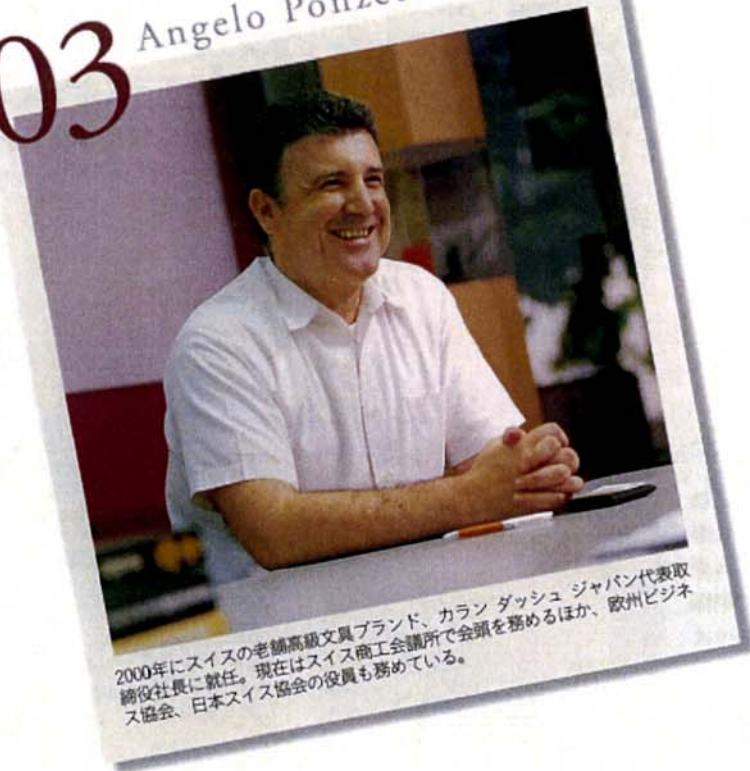
2000年にスイスの老舗高級文具ブランド、カラン ダッシュ ジャパン代表取締役社長に就任。現在はスイス商工会議所で会頭を務めるほか、欧州ビジネス協会、日本スイス協会の役員も務めている。